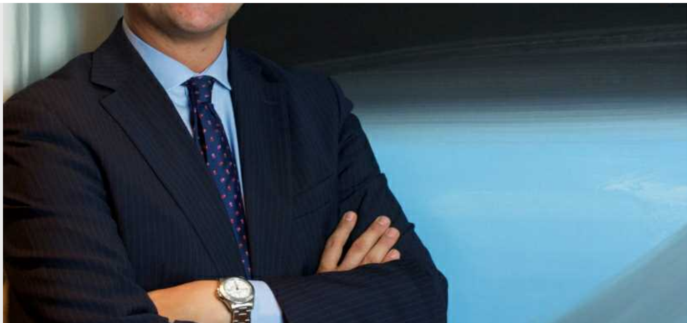
MARCO GAY , PRESIDENTE ANITEC-ASSINFORM

Anitec-Assinform – Associazione Nazionale delle imprese ICT e dell’Elettronica di Consumo – aderente a Confindustria e socio fondatore della Federazione Confindustria Digitale – è l’Associazione di settore di riferimento per le aziende di ogni dimensione e specializzazione: dai produttori di software, sistemi e apparecchiature ai fornitori di soluzioni applicative e di reti, fino ai fornitori di servizi a valore aggiunto e contenuti connessi all’uso dell’ICT ed allo sviluppo dell’Innovazione Digitale. Ha sede a Milano e Roma.