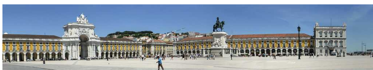
Lisbona, piazza del Commercio