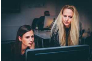
Le professioni ICT

Il progresso è avvenuto in tutte le "famiglie" delle professioni dell'ICT, anche se a due velocità: più marcata per quelle nelle aree di Design, Business, Emerging e Support , con tassi di crescita trimestrali dal 22 al 31%, e meno marcata, ma pur sempre significativa, nelle aree di Process Improvement e Development (rispettivamente, +11% e +9%).