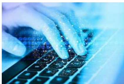
La corsa alle figure digitali è ripresa