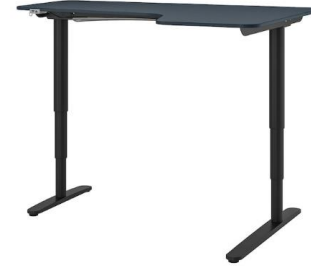
Mod. BEKANT di IKEA a regolazione variabile

Modello Logitech K400 plus , combo integrata tastiere- touchpad, wireless