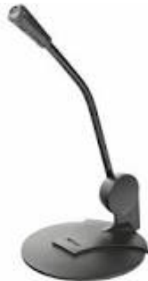
Microfono e software riconoscimento vocale Dragon + Windows 10

Modello Logitech K400 plus , combo integrata tastiere- touchpad, wireless