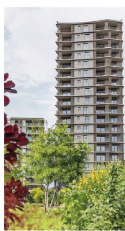
Uptown. Una torre del complesso che sorge a Milano in zona Cascina Merlata

Anche a Roma sono in fase di realizzazione appartamenti in contesti esclusivi, improntati all'efficienza energetica, come i progetti Porta dei Leoni (Fondo Leone-Dea Capital) oppure UpTown Gardens (Green Stone Funds, Compagnia immobiliare italiana, Coldwell Banker). In entrambi i casi il design interno e l'arredamento sono stati