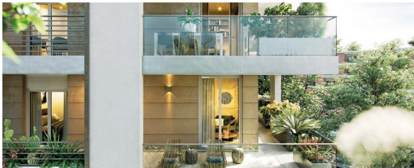
A Roma. Il progetto Porta dei Leoni (Fondo Leone-Dea Capital) punta su efficienza energetica e dotazioni esclusive